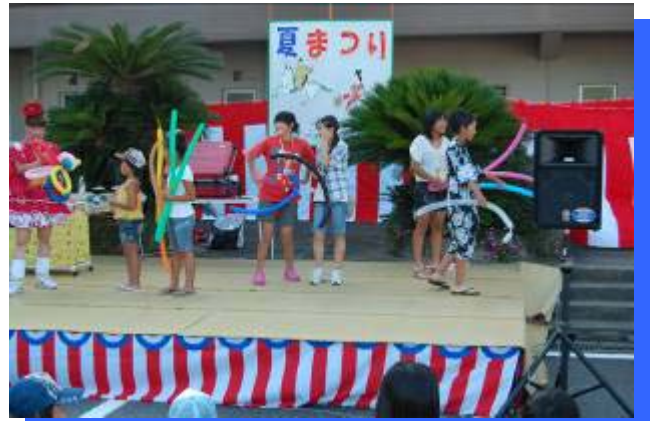
ステージも新調！！ 子ども達の初舞台。大道芸飛び入り