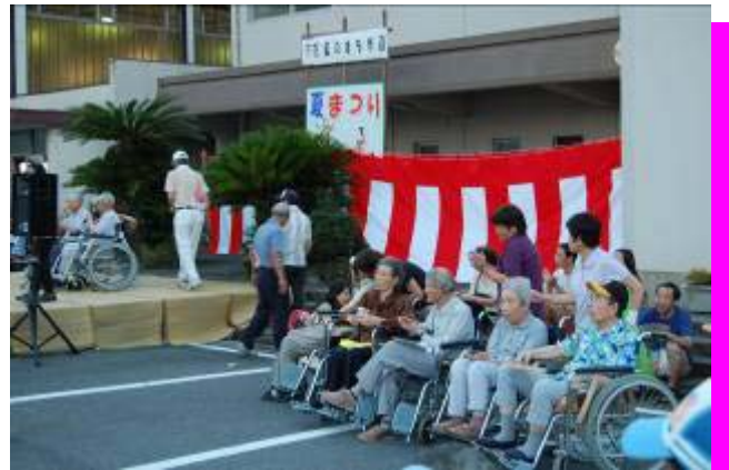
今年も大好評！！ カラオケ大会。。