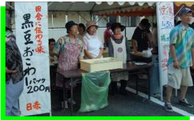
根強い人気の黒豆おこわ 《日赤奉仕団》