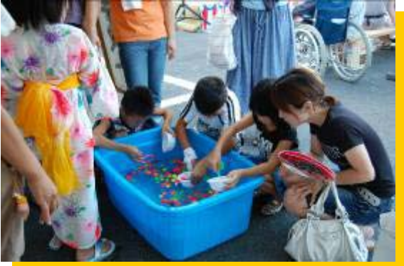
スーパーボールすくい！！ 《子ども会》