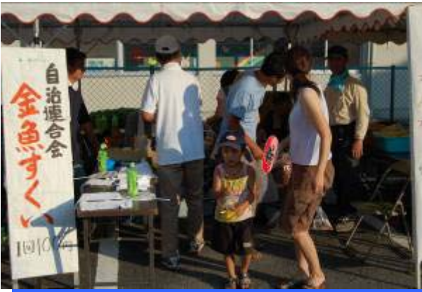
大きく育て ボクの金魚！！ 《自治連合会》