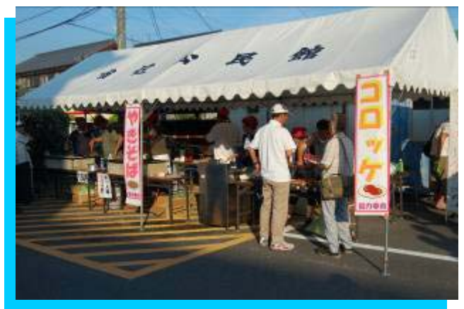
まつりの最後まで行列つづき！！《コミセン協力員》