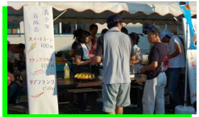
売り切れゴメン 《青少年育成会》