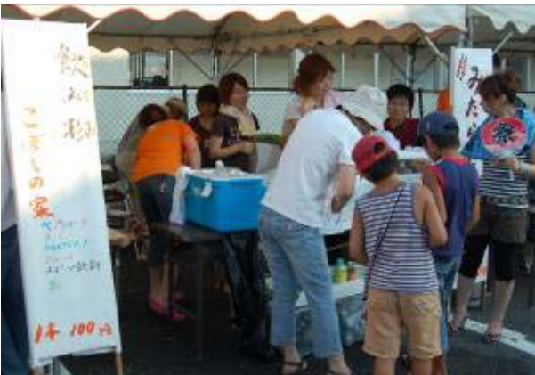
ア~ アツイ。冷たいジュース1本！！ 《こぼしの家》