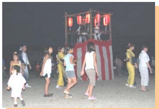
市辺地区の輪 盆踊り！！ 江州音頭