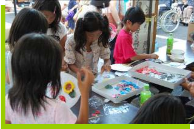
暑さを飛ばせ！ 絵団扇作り 《老人クラブ 連合会》

各団体とも、バザーへの御協力ありがとうございました。 暑さとの戦い！お疲れ様でした。