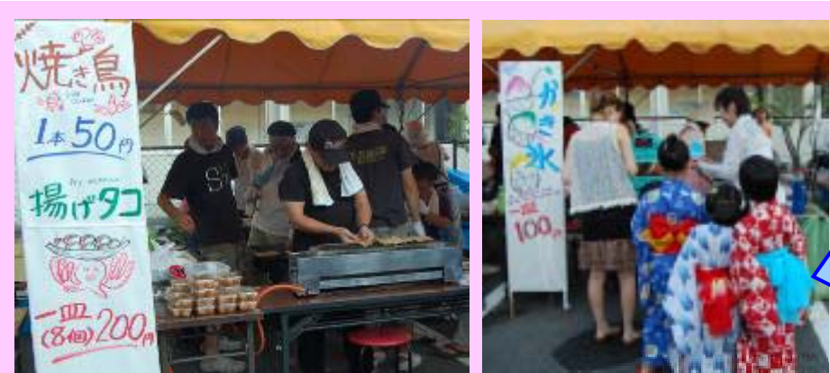
まつりの定番、焼き鳥、揚げタコ、かき氷 子どもたちも殺到！ 《体育協会》

ゆかた着付け教室開催！ その場でゆかたへ大変身 夏まつりは、 やっぱりゆかた。。。かな 《地域教育協議会》