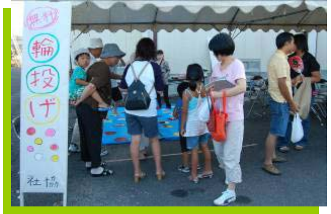
入るかなあ？ あのオモチャ！！《社会福祉協議会》