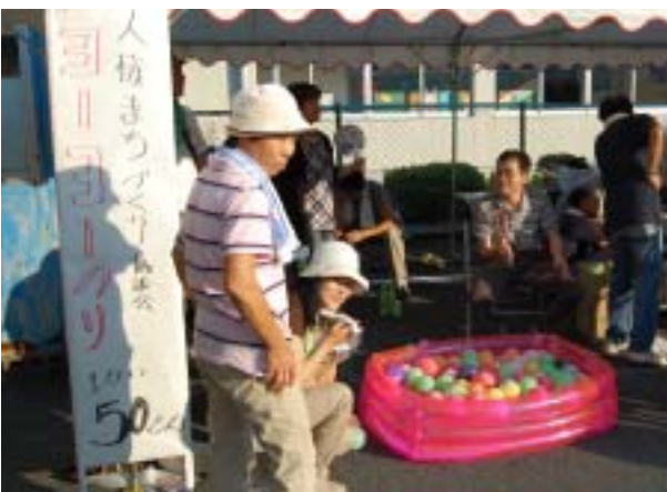
みんな集まれ！！ヨーヨーつり 《人権協》