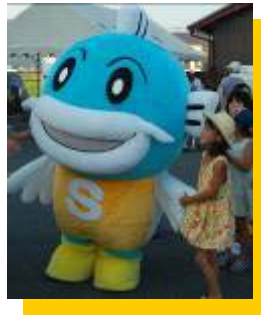
スポレクのキャプフィー登場！！ 大人気。次も来てネ！